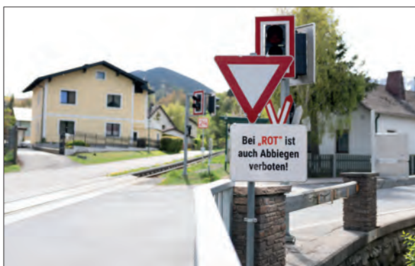
Foto 1: Das Abbiegen in den Zahnradbahnweg und den Hinteren Bahnweg ist bei leuchtendem Rotlicht verboten.

Mit den leopoldi Regionalbuslinien 330 und 350 sowie den Zügen der ÖBB kann man entspannt und autofrei zur Schneebergbahn (Bahnhof Puchberg) anreisen. Alle Verbindungen finden sich auch auf https://routing.leopoldi.info/ .