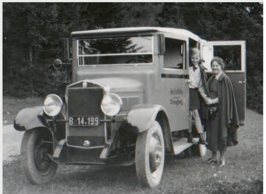
Im Bild oben der Kleinbus der Heilstätte Strengberg in einer Aufnahme aus dem Jahr 1930.

Mit der zunehmenden Motorisierung stieg auch die Zahl der Verkehrsunfälle. Der erste wirklich schwere Unfall mit einem Auto ereignete sich am 27. Mai 1936. Die Tagespresse meldete: „Heute gegen 6.30 Uhr abends stürzte der Kraftwagen der Lungenheilstätte Strengberg, Gemeinde Puchberg, auf der Privatstraße zur Heilstätte über eine Böschung und überschlug sich. Das Auto war mit neun Personen besetzt. Maschinenbetriebs-Inspektor Otto Schmitz aus Wien, ein Bruder des Bürgermeisters von Wien, wurde getötet.“ Drei Personen, alle hohe Beamte des Wiener Magistrats, wurden schwer verletzt, vier weitere Personen leicht. Die Unfallursache konnte nicht zweifelsfrei festgestellt werden. Die kurvenreiche, enge und teilweise steile Straße war, wie zeitgenössische Bilder zeigen, seitlich nicht abgesichert.